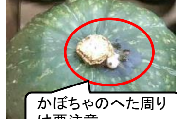
かぼちゃのへた周り は要注意