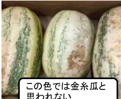
この色では金糸瓜と思われない